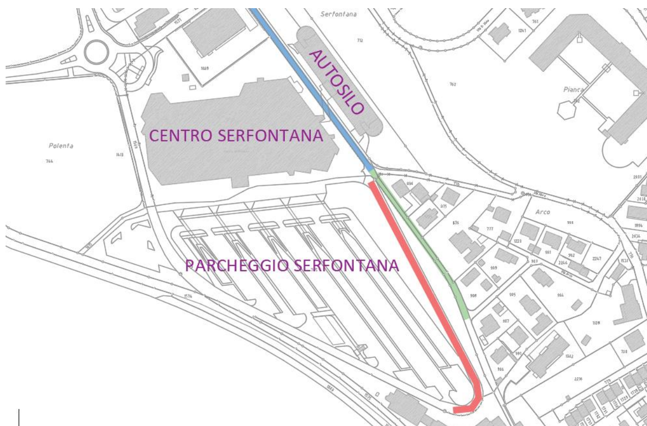
Figura 3: Estratto planimetrico bacino di adduzione

Le tubazioni comunali e consortili sono sottodimensionate alle esigenze attuali, situazione che determina problemi di rigurgito. In corrispondenza dell'incrocio in Via Serfontana-strada privata fmn 1302 è ubicato il pozzetto d'ispezione consortile 4d002, nel quale è presente un troppo pieno provvisorio e rudimentale (tubo in PVC DN 400) che scarica nel pozzetto 288 delle acque meteoriche. La canalizzazione delle acque meteoriche ha origine in zona Pianca con un tracciato ubicato prevalentemente su fondi privati, la tratta finale (TC 1000 mm) passa sotto allo stabile "Corona" e si immette nel fiume Breggia.