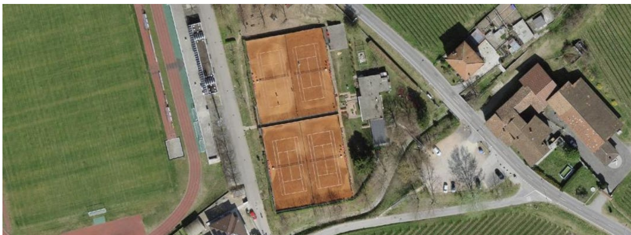
Ortofoto della zona

Con una forma rettangolare delle dimensioni di circa 44.00 x 13.00 ml, il nuovo edificio avrà una volumetria totale di circa 4'000 mc, suddivisi equamente tra piano interrato e piano terreno.