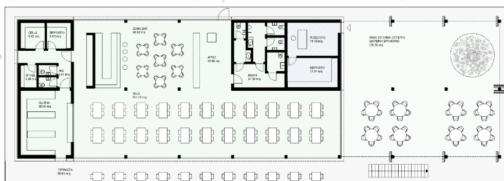
Piano terreno / Pianta bar-ristorante

Il progetto prevede la sistemazione del parcheggio ed il rifacimento del passaggio pedonale sopra il riale nel rispetto delle normative vigenti, soprattutto per le persone diversamente abili.