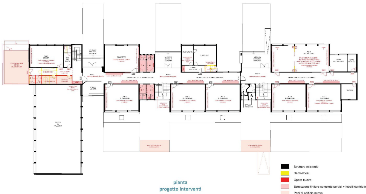
Pianta piano terreno del progetto di massima