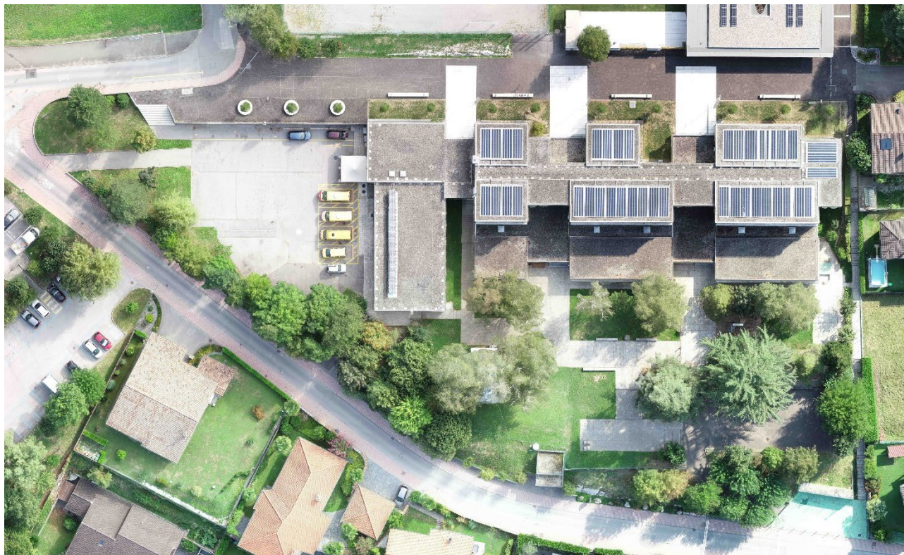
Rilievo eseguito nel 2021

In seguito, dopo attenta valutazione, è stato dato un secondo mandato per verificare la fattibilità per un risanamento energetico dell'involucro esterno, in quanto l'attuale stratigrafia dell'edificio è molto lontana dagli standard di risparmio energetico attuali.