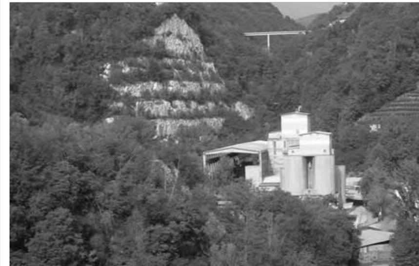
L'area dell'ex cementificio fotografata oggi