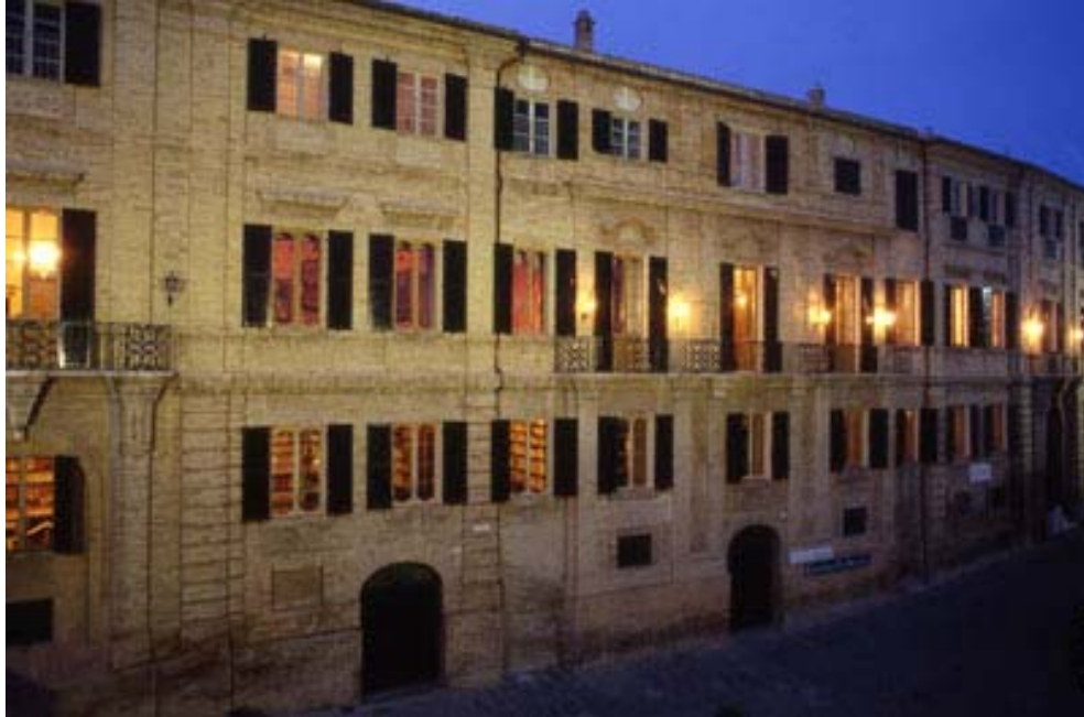
La casa natale di Giacomo Leopardi