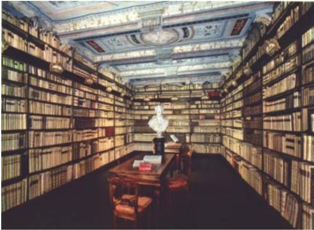
La biblioteca di casa Leopardi