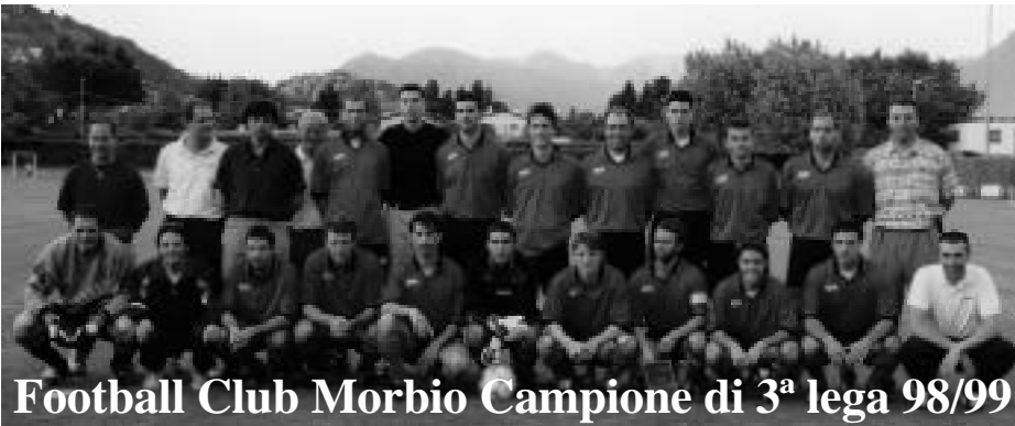
Football Club Morbio Campione di 3 a lega 98/99

Per chi fosse interessato alla storia del Football Club Morbio, alla conoscenza della sua struttura organizzativa, alla consultazione "online" dell'agenda delle manifestazioni nonché alla lettura della cronaca delle partite, la società informa che, da agosto 99, esiste un sito internet all'indirizzo http://www.fcmorbio.com