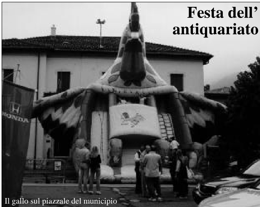
Il gallo sul piazzale del municipio